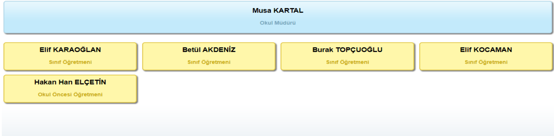
Şekil 1: Organizasyon Şeması